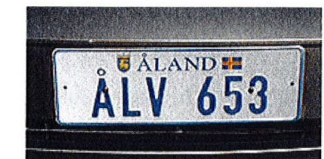
Autonummernschild von Åland